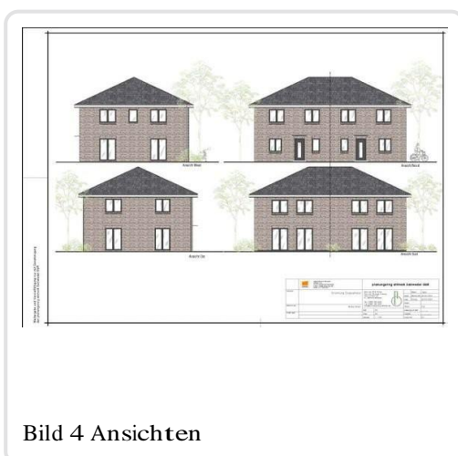
Bild 4 Ansichten