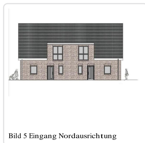
Bild 5 Eingang Nordausrichtung