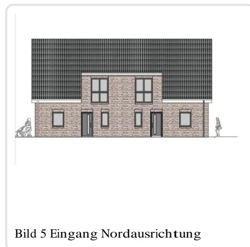
Bild 5 Eingang Nordausrichtung