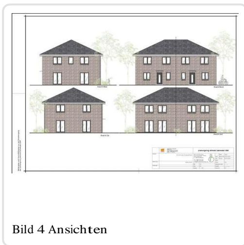
Bild 4 Ansichten