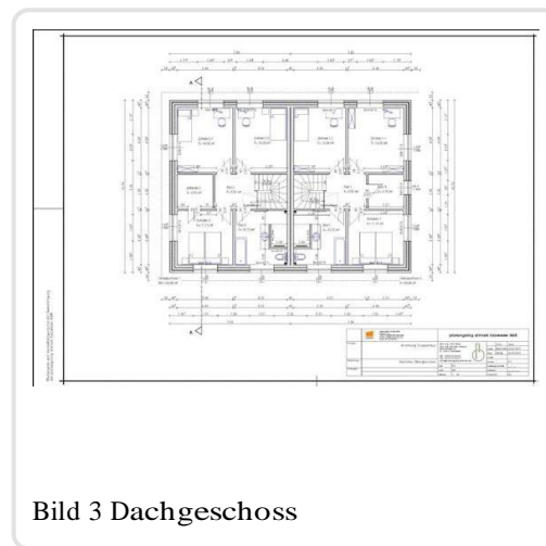
Bild 3 Dachgeschoss