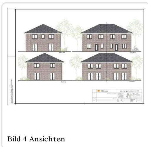
Bild 4 Ansichten